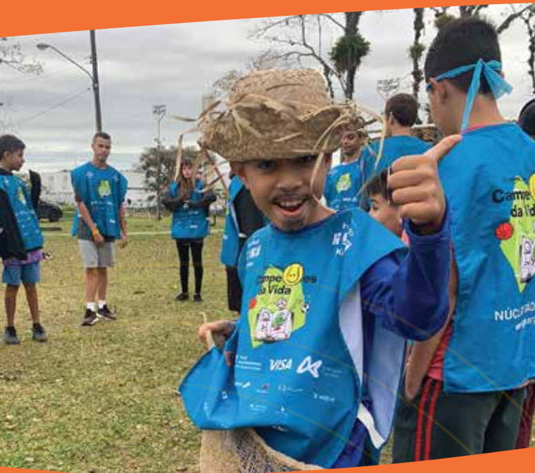
Arriaiá do IGK