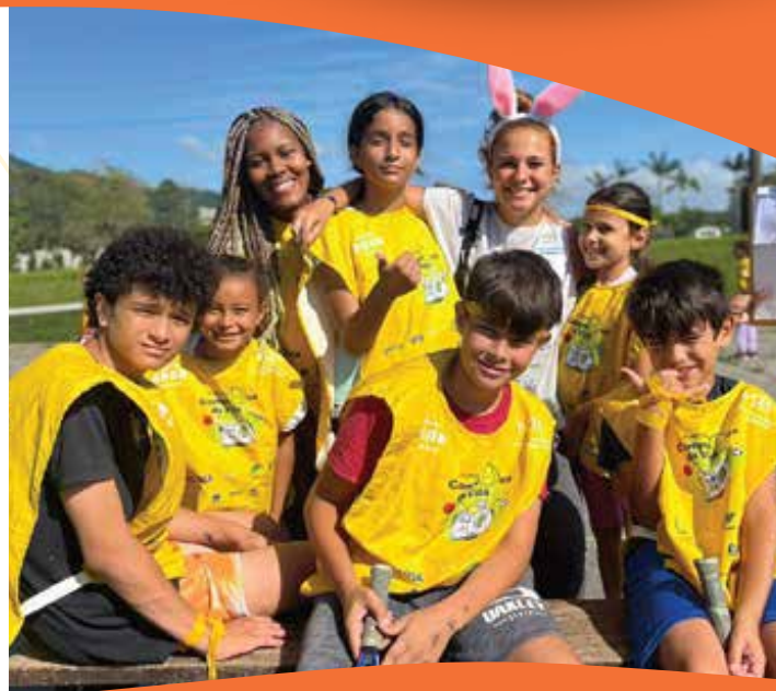
Dia do amigo