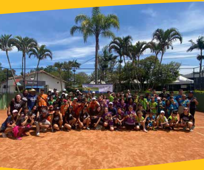
Projeto Gerando Oportunidades Através do Tênis