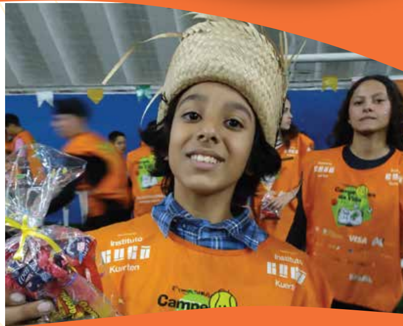
Semana da rede Socioassistencial