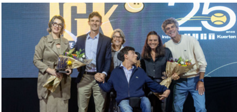
Prêmio Especial Caroline Kern