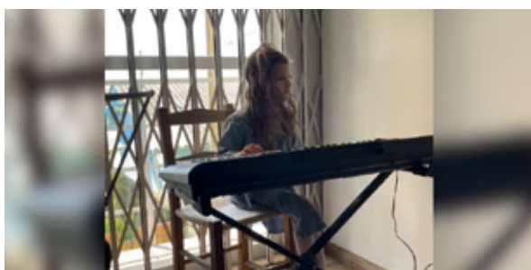
Prêmio Inspiração Eduarda Ciota