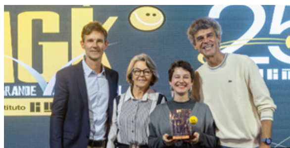
Inclusão Social Des Editora