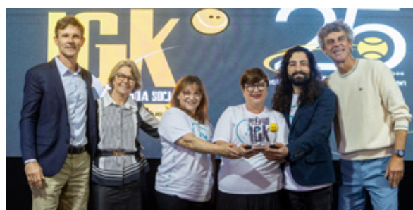
Projeto Social Projeto Além dos Olhos